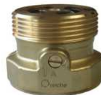
Bsp. Typ: PV-KA... DN 20-32